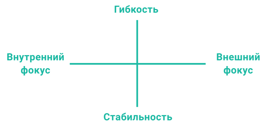
Модель конкурирующих ценностей Камерон и Куинн (1999)